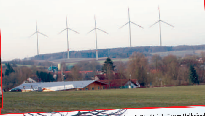
Blick auf die „Dick“ vom Kindergarten Ottrau*