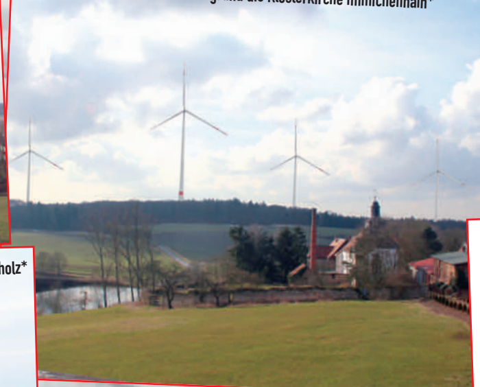
Blick auf „Die Gleiche“, im Vordergrund die Klosterkirche Immichenhain*