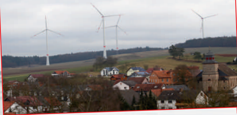
Realität in Ruhlkirchen – KEINE Fotomontage